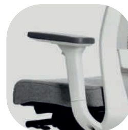
Braços reguláveis 3D