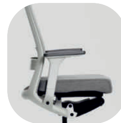
Assento ajustável em profundidade