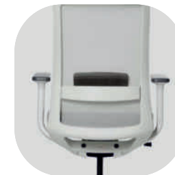
Apoio lombar flexível, altura ajustável