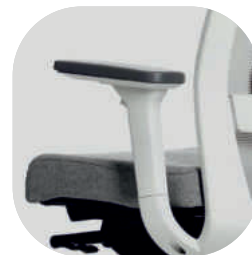
Braços reguláveis 3D