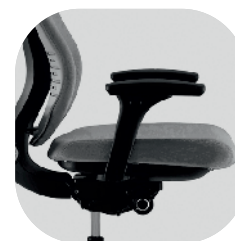
Assento ajustável em profundidade