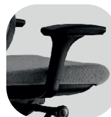
Braços reguláveis 2D/3D